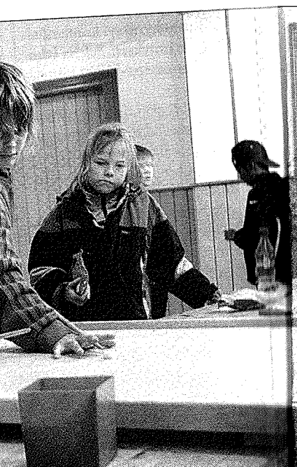
nen pelaavat koronaa.