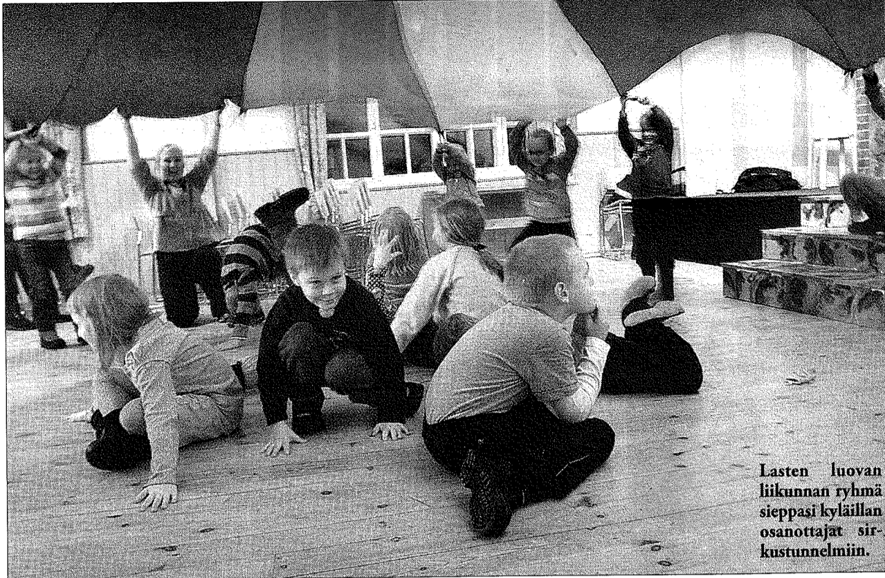
Lasten luovan liikunnan ryhmä sieppasi kyläillan osanottajat sirkustunnelmiin.