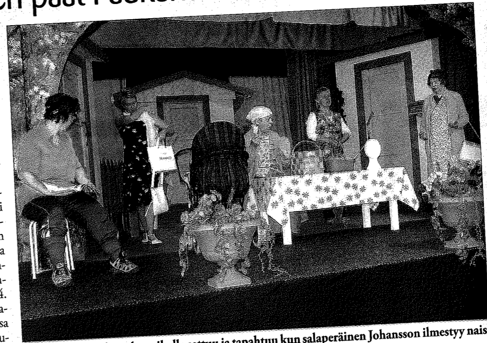
Eläkeläisten vuokratalon pihalla sattuu ja tapahtuu kun salaperäinen Johansson ilmestyy naisasukkaiden elämään.