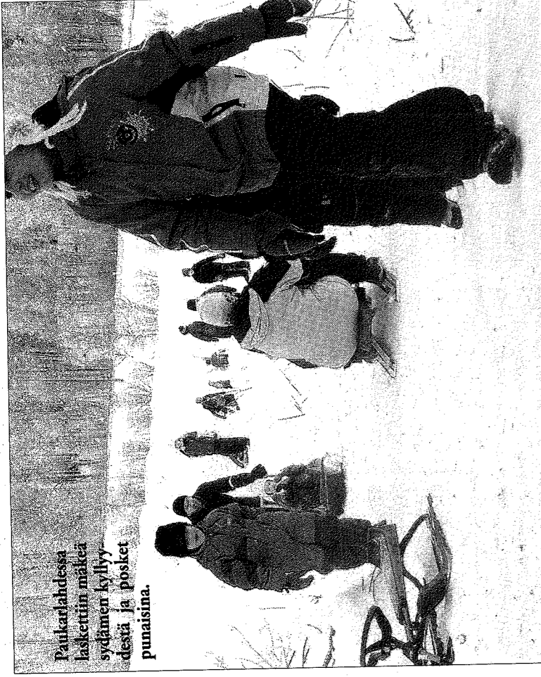
Paukarlahdessa laskettiin mäkeä sydämen kyllyydestä ja posket punaisina.

Kahden pienen tytön pulkka kiittää kovaa vauhtia ohii ja pulkasta kuuluu kova ääni.