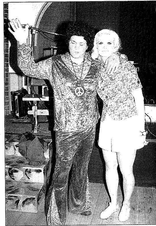
Raati palkitsi Tuulan ja Jonen 60-luvun puvut; mi-nihameen vallankumou, peace-merkki ja hippipukul