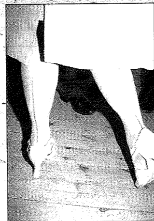
Saumasukat ja popliinitakki olivat must 60-luvulla!