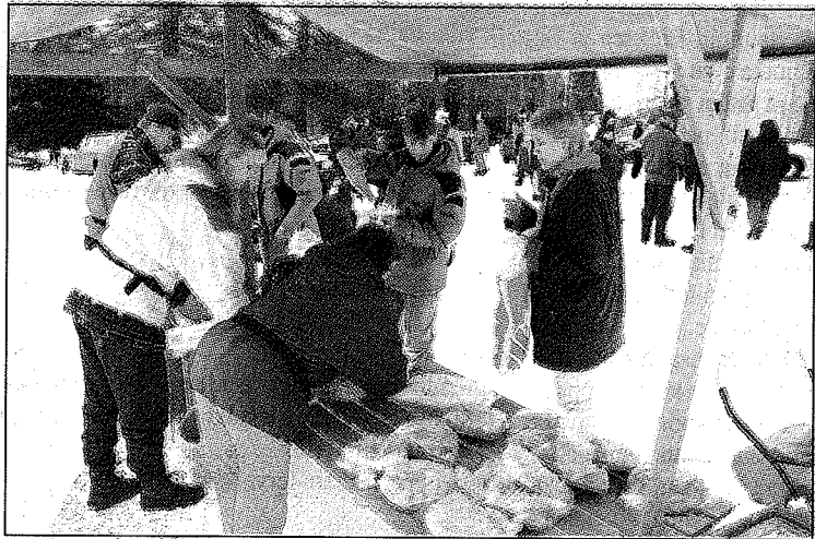
Lämpimänä pakkasmarkkinoilla Paukarlahden koulun pihalla piitivät mehu- ja kuumat makkarat.